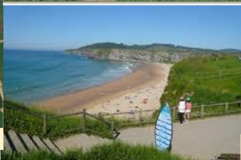
PLAYA DE LANGRE